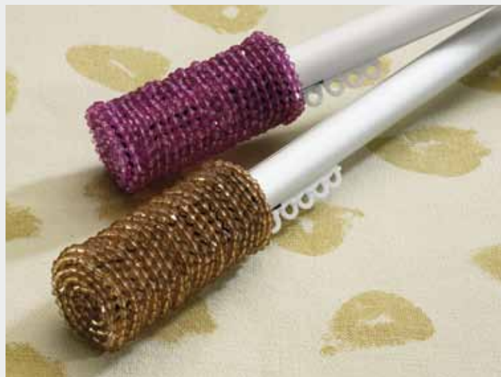
1003 Metropole con Pepito