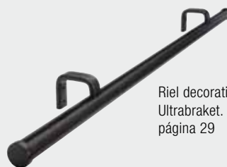
Riel decorativo color negro con Ultrabaket. Para más información, página 29

Dispone de ultrabaket en los acabados: negro, galvanizado, efecto cromado y plata.