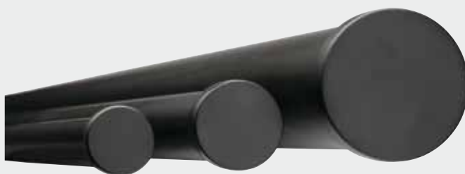
Comparativo de los diferentes formatos de rieles en 23 mm, 30 mm y 50 mm.