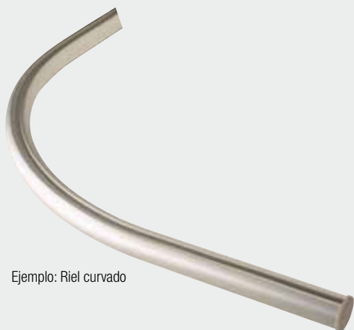
Ejemplo: Riel curvado