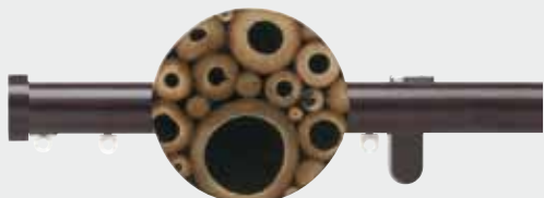
Ejemplo: Embellecedor intermedio