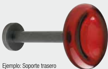
Ejemplo: Soporte trasero