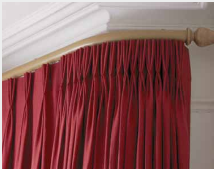
6140 con curvatura para una ventana bahía.