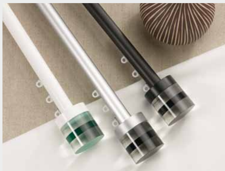
1003 Metropole con Crystal