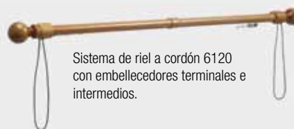
Sistema de riel a cordón 6120 con embellecedores terminales e intermedios.

Sistema de riel a cordón 6120 con diferentes embellecedores terminales que encontrará en las páginas siguientes.