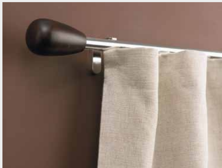
1003 Metropole con Paddle